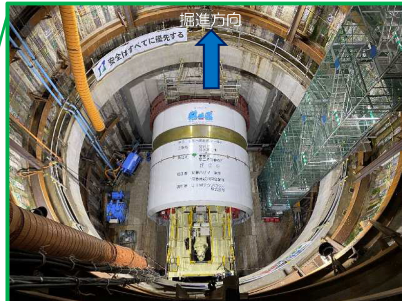
発進立坑内のシールドマシン（令和3年4月6日現在）