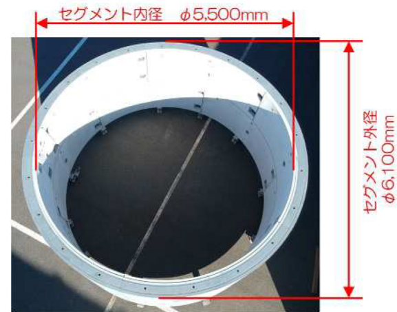
工場におけるセグメント水平仮組立状況（2リング）